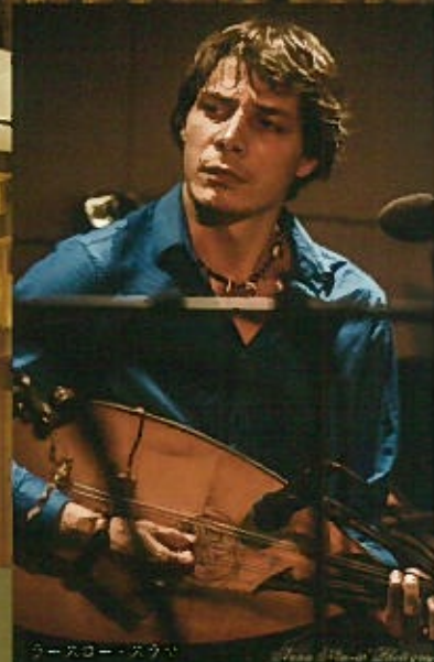
ラースロー・スラマ