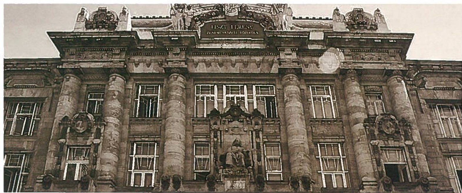
リスト音楽院 Liszt Ferenc Zeneművészeti Egyetem